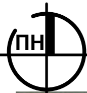
Схема розташування території у планувальній структурі населеного пункту с.Кінчеш М1:5000